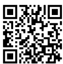
<<攜手抗疫—2019 冠狀病毒病>>醫管局病人專頁二維碼

受疫情影響，醫院管理局暫緩了部分非緊急服務，集中資源以應對挑戰。有見本地疫情稍為緩和，醫管局亦按實際環境及需要逐步恢復服務。為讓病人及照顧者足不出戶亦可接收到最新的醫管局服務安排和相關健康資訊，醫管局特別設立<<攜手抗疫—2019 冠狀病毒病>>醫管局病人專頁 ( http://www.ha.org.hk/covid )。大家可透過專頁了解醫管局的服務安排、健康建議、社區資源等等。